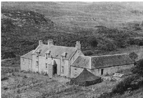
Barnhill, Isle of Jura, 1948. Hier schreef Orwell het grootste deel van Nineteen Eighty-Four.