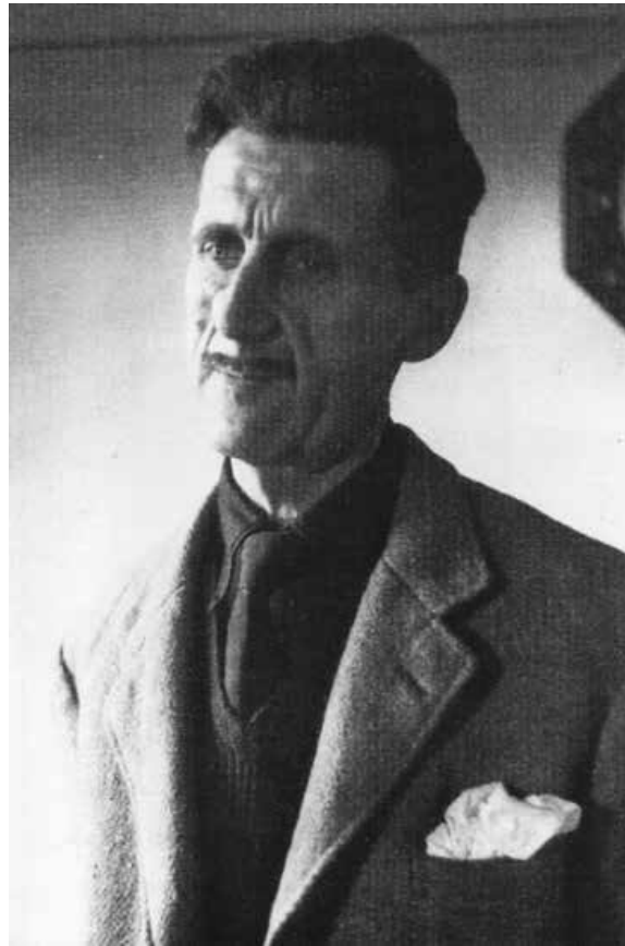
Orwell, 1946. 'Een verre van gezonde man.'

Orwell was gegrepen. Van jongs af aan fascineerde Robinson Crusoe hem. Het vooruitzicht ooit een op zelfvoorziening gericht leven te leiden op een Hebriden-eiland, waar hij verwijderd zou zijn van de gruwelen van de moderne tijd, begon hem toe te lachen. 2 Een maand na de Dickens-conferentie noteerde hij in zijn dagboek: 'Thinking always of my island in the Hebrides, which I suppose I shall never possess nor even see. Compton Mackenzie says even now most of the islands are uninhabited [...] and most have water and a little cultivable land, and goates will live on them.' 3 Orwells eilanddroom ging pas na de Tweede Wereldoorlog in vervulling. Op aandrang van zijn vriend David Astor, redacteur van The Observer , een krant waaraan hij meewerkte, koos hij uiteindelijk voor Jura. Tussen mei 1946 en januari 1949 zou hij er ongeveer zes maanden per jaar verblijven, wonend in het huis Barnhill. Anders dan de schrijver Cathcart in het verhaal van